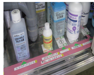
置き場の明確化・定数の明示