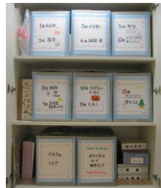
ものを探すムダがなくなる...