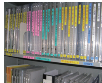
書類を探す時間 30秒以内